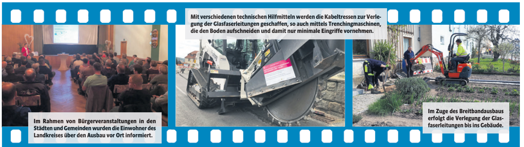
Mit verschiedenen technischen Hilfsmitteln werden die Kabeltressen zur Verlegung der Glasfaserleitungen geschaffen, so auch mittels Trenchingmaschinen, die den Boden aufschneiden und damit nur minimale Eingriffe vornehmen.

Figur, Gewicht, Bewegung und in diesem Zusammenhang der Umgang mit Genussmitteln, von A wie Alkohol bis Z wie Zucker. Alles soll besser und vernünftiger werden.