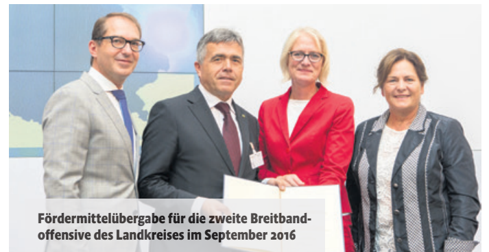
Fördermittelübergabe für die zweite Breitbandoffensive des Landkreises im September 2016

Weber. Die Ausbaurbeiten im Gesamtprojekt sind inzwischen weit vorangeschritten und werden in den nächsten Monaten kontinuierlich fertiggestellt. Ich bin froh, dass es uns als Landkreis gelungen ist, dieses Riesenprojekt übergreifend in die Hand zu nehmen, um das schnelle Internet als bedeutenden Standortfaktor nahezu überall im ländlichen Raum zu etablieren.“