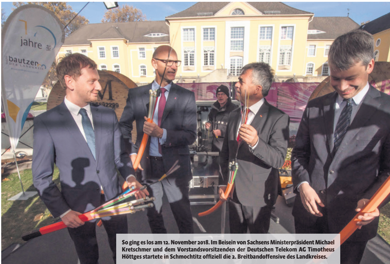
So ging es los am 12. November 2018. Im Beisein von Sachsens Ministerpräsident Michael Kretschmer und dem Vorstandsvorsitzenden der Deutschen Telekom AG Timotheus Höttges startete in Schmochtitz offiziell die 2. Breitbandoffensive des Landkreises.

Der erste große Meilenstein beim aktuellen Breitbandausbau im Landkreis Bautzen ist geschafft. Das Förderprojekt Cluster 6, zu dem die Gemeinden Nebelschütz, Räckelwitz, Crostwitz, Puschwitz, Neschwitz, Radibor, Pan-