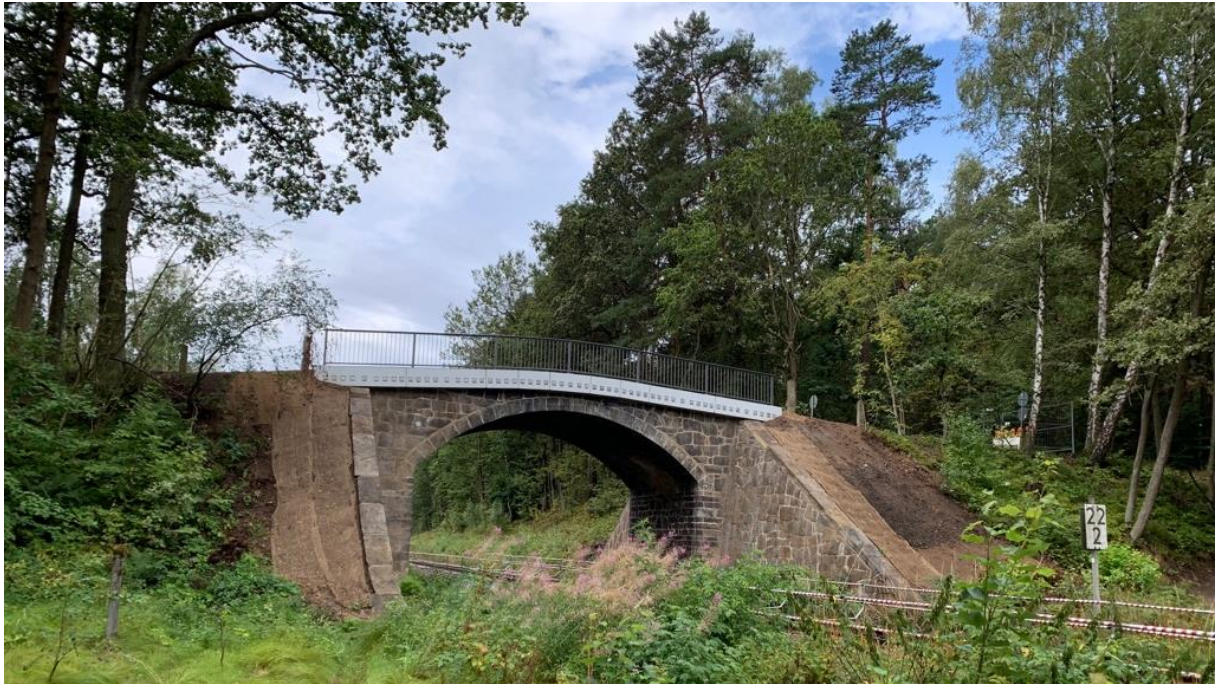
Ausbau einer vorhandenen, denkmalgeschützten Bogenbrücke in der Flurbereinigung Wallroda