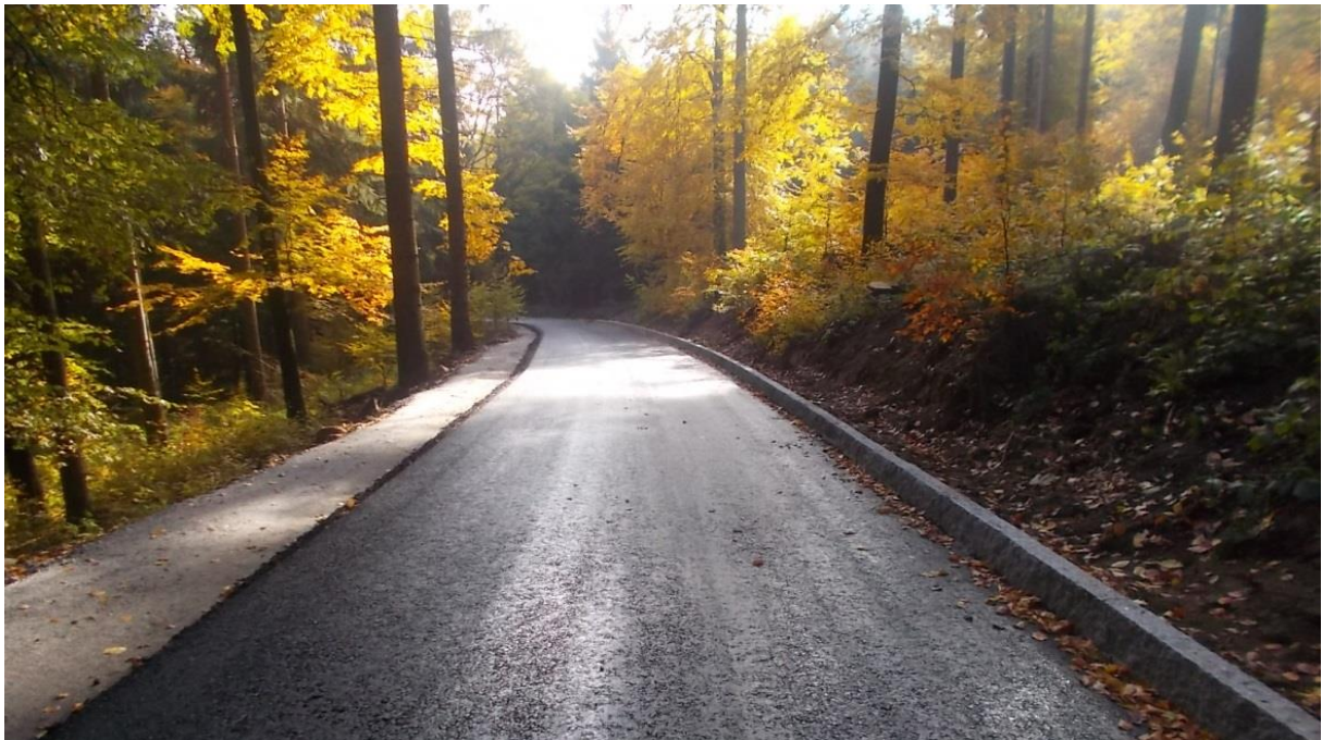
Weg zum Czorneboh im Ausbau im Rahmen der Flurbereinigung Cunewalde, Quelle: Ines Westphal, Teilnehmergeinschaft Cunewalde