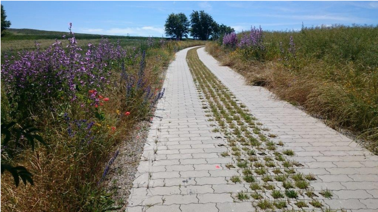
Sandbergweg mit Blühstreifen in der Flurbereinigung Rammenau, Quelle: Ines Westphal, Teilnehmergeinschaft Rammenau