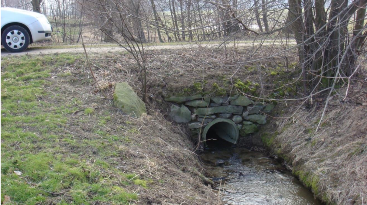
Erneuerung Durchlass über Weißnaußlitzer Wasser Flurbereinigung Gnaschwitz, Quelle: Ines Westphal, Teilnehmergeinschaft Gnaschwitz