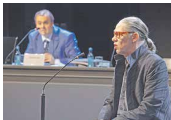
Im Stück tagt der fiktiv besetzte Deutsche Ethikrat und verhandelt auf der Bühne den Sterbewunsch Richard Gärtners. Das Publikum entscheidet mit.