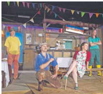
»Jaja z kraja« komedija wot Frederika Holtkampa – premjera 19. měrc 2022 w Hochozy

Kajke kotwrotné časy leža za nami, poľne zakazow, wobmjezowanjow a za nas jako džiwadło rěkaše nastajnosći: zawrěć, přesunyc, wotewrěć, znova přesunyc, sćerpny wostać, sebje a wokolinu škitać, sej dołhi dych zdzeržec, kreatiwitu a zapal dozěrować a zaso wotewrěć. Wuchadžamy raz z toho, zo směmy zaso dlěje hrać a Wam skónčnje to pokazać, štož sym Wam tež hižo loni slubiła: žortne, napjate a jimace džiwadło za wšě generacije we woběmaj serbsčinomaj. Ale njeje jenož tak, zo smy jenož přesuwali, tež nowe stawizny su k tomu přišli, tuž mamy dobru měšecnu poskitka toho, štož njejsće zawrjenja dla widzeć móhli a překwapjenku, wo kotrejž so scyła hišće rěčało njeje. Zo změjemy w nowej hrajnjej dobie znova dvě wulkej serbskej inscenaciji na hłownym jewišću je woprawdžite wudobyće. Po jónkrótnym premjernym předstajenju we februarje 2020 chcemy Wam komediju »Dothož fenki běža« z nowymaj hrajerkomaj w nazymje znova na hłownym jewišću předstajeć.