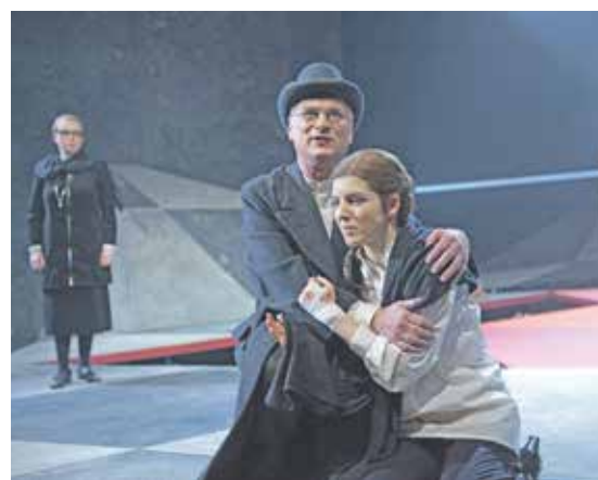
Lessings Botschaft ist heute aktueller als denn je.