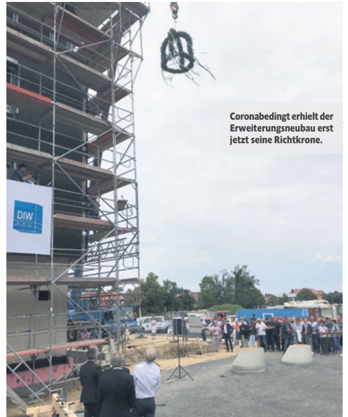
Coronabedingt erhielt der Erweiterungsneubau erst jetzt seine Richtkrone.

Die weiterführende vollständige Sanierung des Altbaus erfolgt nun in dem Gesamtprojekt als 2. Bauabschnitt im Altbau.