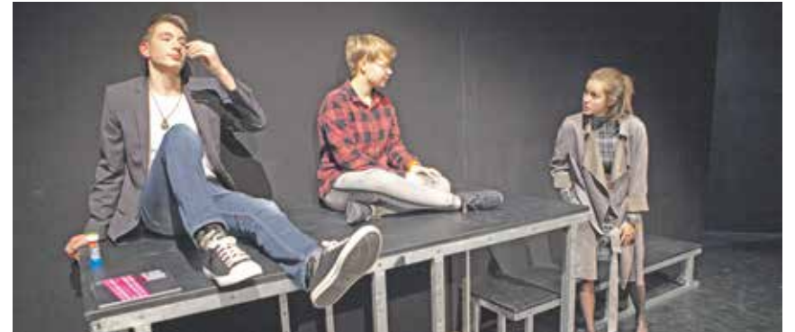
Der Theaterklub für junge Leute brachte in den vergangenen Spielzeiten »Frühlingserwachen 2.0« auf die Bühne.

Die künstlerische Leitung des Theaterklubs liegt in den Händen von Christian Schröter, Theaterpädagoge am Thespis-Zentrum Bautzen