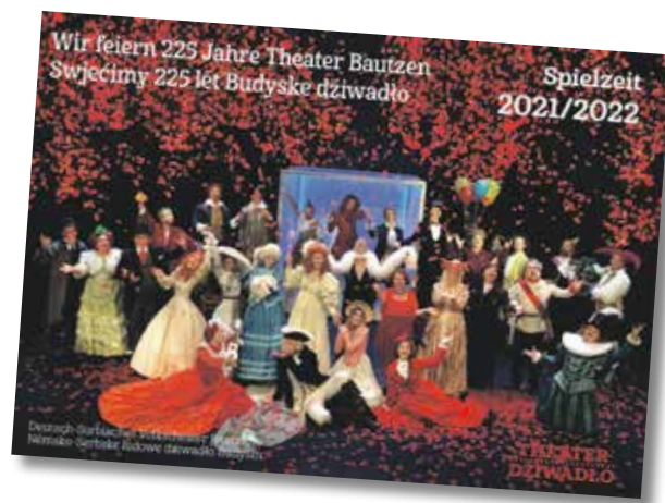
Unsere neue Spielzeit steht unter dem Motto »Wir feiern 225 Jahre Theater Bautzen Swjećimy 225 lět Budyske dźiwadło«.