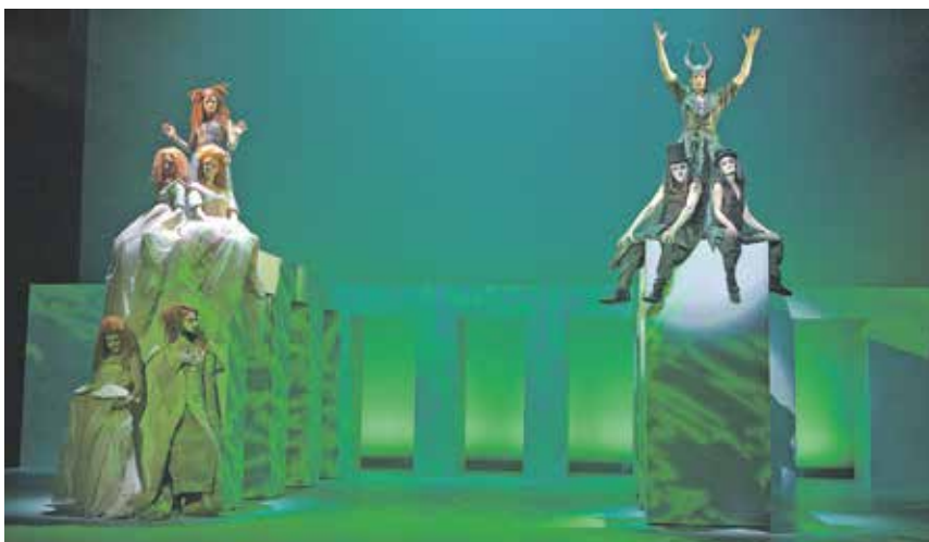
Unter anderem können Sie sich auf Shakespeares Komödie EIN SOMMERNACHTSTRAUM im Premierenabonnement freuen.

Telefon: 03591 / 584 270 und 584 273 a.hillmann@theater-bautzen.de