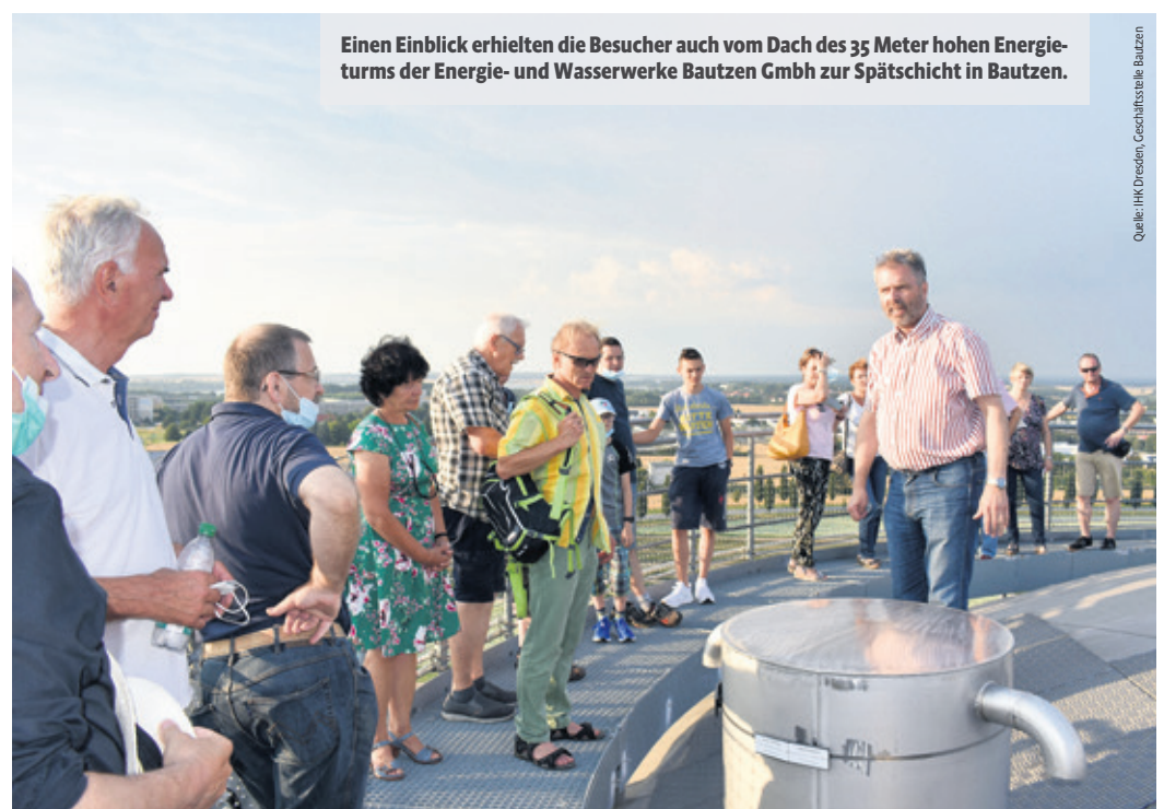
Einen Einblick erhielten die Besucher auch vom Dach des 35 Meter hohen Energieturms der Energie- und Wasserwerke Bautzen GmbH zur Spätschicht in Bautzen.

Regionale Wirtschaft hautnah erleben! – Die Spätschicht findet statt.