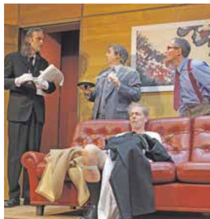
»Dothož fenki běža« – premjera: 11. septembra 2021 na hłownym jewišću

... je žiwjenje bjezstarostne. A hdyž džiwadło zaso hraje, je žiwjenje pisaniše. Lětsa budže hłowne jewišće NSLDž hnydom dwójce ze serbskim džiwadłom pjelnjene. Prěnja premjera noweje hrajnjej doby budže britiska komedija Micheala Cooneya, w serbskim přetožku Měřany Cušcyneje » Dothož fenki běža « 11.09.2021