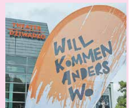
Das Thespis Zentrum ist nicht nur in den Räumen auf der Goschwitzstraße in Bautzen zu erleben, sondern inzwischen im gesamten Stadtgebiet on tour.

Diese und weitere Informationen über »Thespis on Tour« finden sich auf unserer Instagram- und facebook-Seite sowie unter: www.thespis-zentrum.de