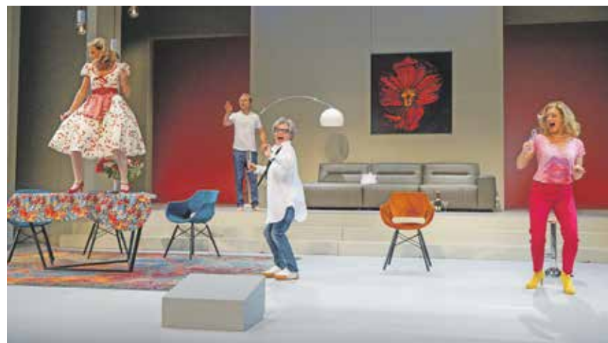
In einer komödiantischen Versuchsanordnung testen Helen und Bastian die Geschlechterrollen aus. Mit auf dem Spielfeld, die beiden Schwiegermütter. Ein skurriles Quartett, das genügend Zündstoff für einen lebhaften Schlagabtausch bietet.