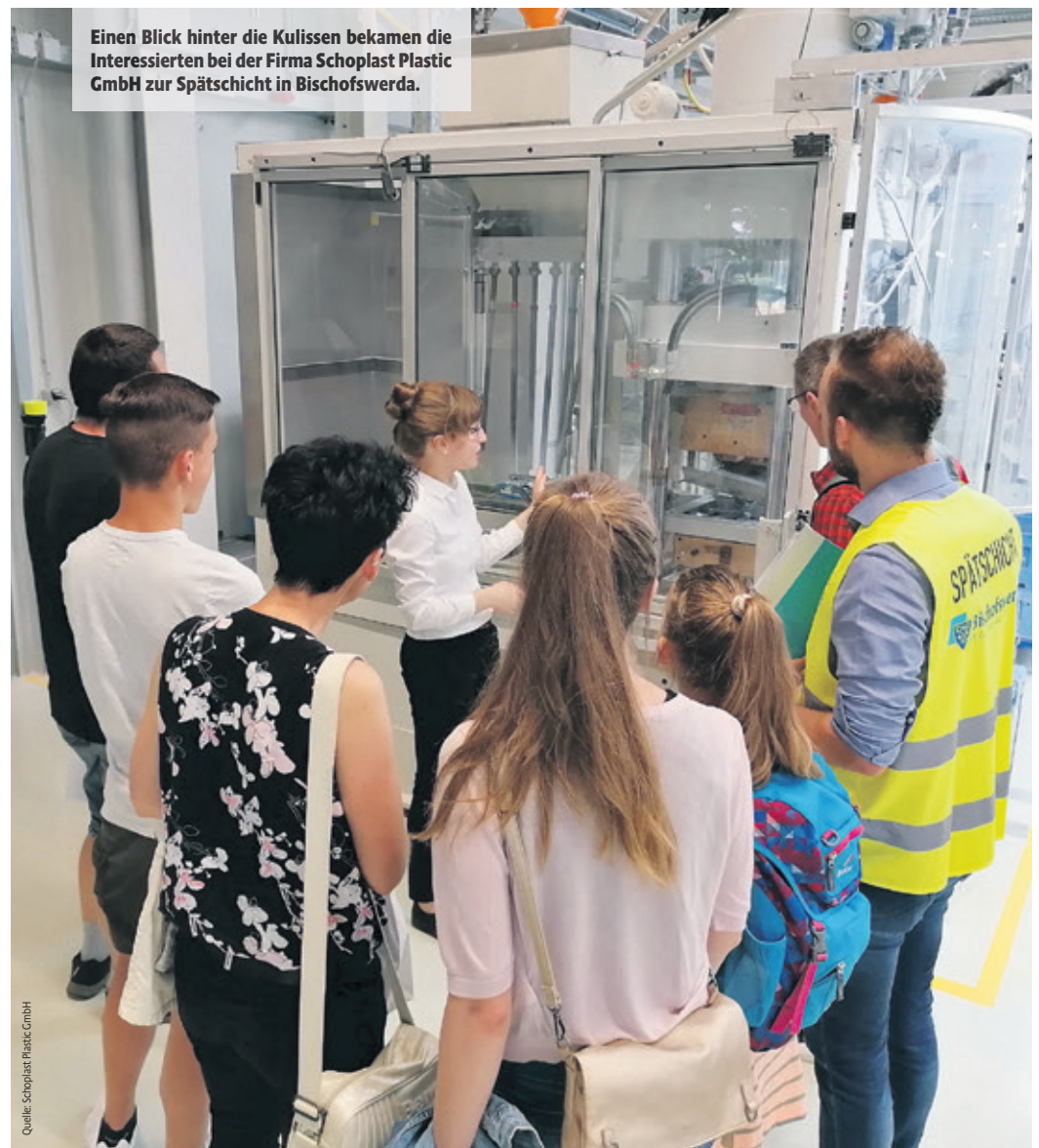
Einen Blick hinter die Kulissen bekamen die Interessierten bei der Firma Schoplast Plastic GmbH zur Spätschicht in Bischofswerda.

Interessierte Unternehmen können sich gern ganzjährig an die Wirtschaftsförderer der Kommunen oder an die Wirtschaftsförderung des Landratsamtes Bautzen wenden, um an der nächsten Spätschicht teilzunehmen.