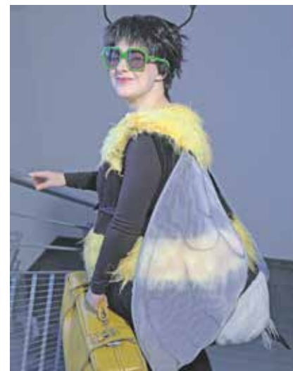
»Čmjela Hana chce do dowola lećeć« – premjera: 16. septembra 2021 w Ralbicach, pěstowarnja

kaž zašte lěta hižo tež, we dwěmaj wariantomaj pokazamy, móžeće wolic za maćernorěčne abo serbsčinu wuknjace džěci.