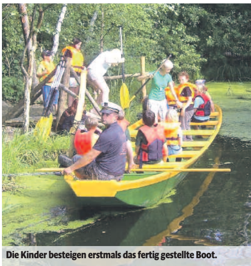
Die Kinder besteigen erstmals das fertig gestellte Boot.

Die Ergebnisse können sich sehen lassen und die Kinder des Abenteuercamps hatten es eilig, den neu benannten „Abenteuerkahn“ umgehend auf seine Praxistauglichkeit zu testen.