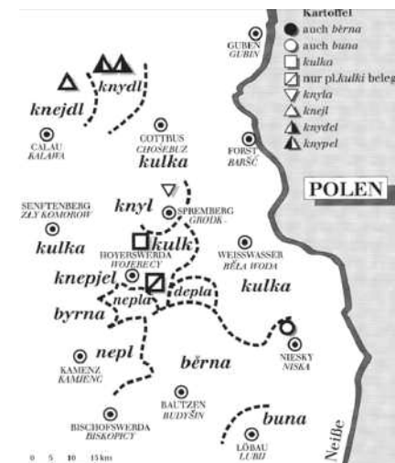
Kartoffelkarte als Beispiel für die sorbischen Dialektregionen

(aus: Sorbischer Sprachatlas, Bd. 1, bearb. von H. Faßke, H. Jentsch und S. Michalk, VEB Domowina-Verlag, Bautzen, 1965, S. 127, Grafiker: Jens Prockat, Autor: Siegfried Michalk)