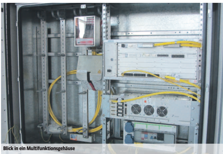
Blick in ein Multifunktionsgehäuse