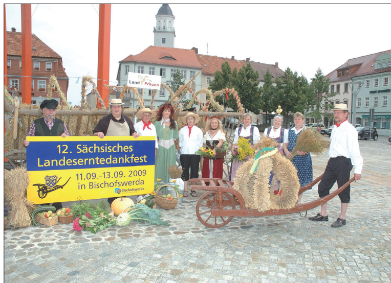
Zum 12. Sächsischen Landeserntedankfest in Bischofswerda soll kulturell viel geboten werden. Deshalb sind Gruppen und Akteure aufgerufen, sich für das Kulturprogramm zu bewerben.