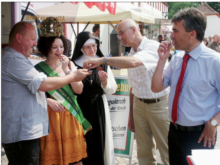
Auf dem Markt beim Klosterfest gibt es immer etwas zu probieren und zu kosten. Das wird in diesem Jahr nicht anders sein.

Die Bewerbungsbögen können auf den Internetseiten der Stadt Bischofswerda ( www.bischofswerda.de ), des Sächsischen Blasmusikverbandes e.V. ( www.blasmusik-sachsen.de ), Menüpunkt Formulare/Downloads, des Landkreises Bautzen ( www.landkreis-bautzen.de ) und des Sächsischen Landeskuratoriums Ländlicher Raum e.V. ( www.slk-miltitz.de ) abgerufen werden. Der letzte Termin für die Abgabe der Bewerbungsbögen für das kulturelle Rahmenprogramm ist der 28. Februar 2009, für die „Krone der Blasmusik“ der 30. März 2009. Wo die Bewerbung einzureichen ist, steht auf dem jeweiligen Bogen. Bei Fragen stehen Volkmar Sowinsky von der Arbeitsgruppe Kultur (Tel.: 01 72 / 3 57 88 78, E-Mail: Volkmar.Sowinsky@ira-bautzen.de ), beim Sächsischen Blasmusikverband e.V. Gunnar Heinz oder die Mitarbeiter der Geschäftsstelle (Tel.: 03 72 06 / 89 41 89, E-Mail: gunnar.heinz@blasmusik-sachsen.de ) und beim Sächsischen Landeskuratorium Ländlicher Raum e.V. Dirk Raffé (Tel.: 03 57 96 / 9 71-20, E-Mail: dirk.raffe@slk-miltitz.de ) gern zur Verfügung.