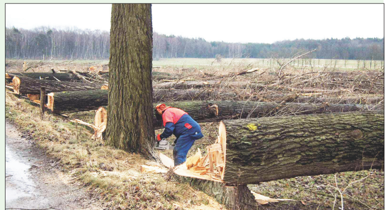
Waldarbeiter des Kreisforstamtes Bautzen bei der Landschaftspflege (Pappelfällungen bei Baruth)