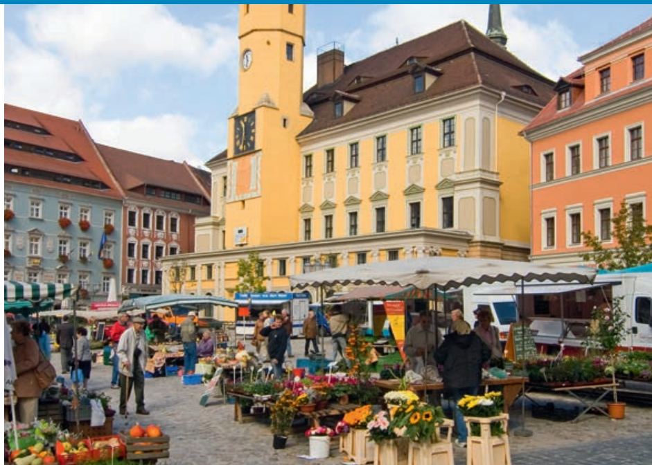
Le grand marché et l'Hôtel de Ville de Bautzen