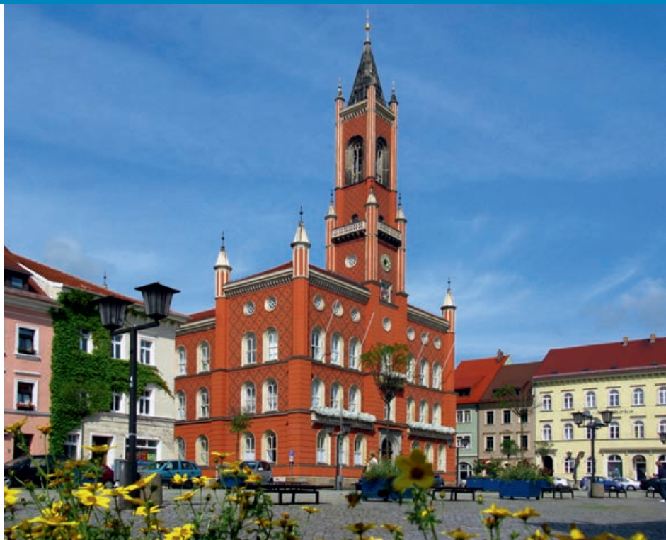
La place du marché et l'Hôtel de Ville de Kamenz