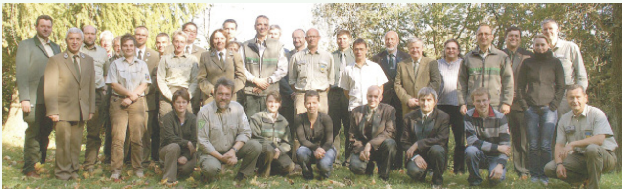
Anlässlich der Fachtagung «Erschließung und Nutzung der Wälder für den Tourismus in der Euroregion Neiße-Nisa-Nysa trafen sich 45 Spezialisten aus Forstverwaltungen, aus dem Bereich Tourismus und Naturschutz aus Polen, Tschechien und Deutschland auf dem Rotstein bei Sohland.

Am 6. Oktober 2011 fand auf dem Rotstein bei Sohland die Fachtagung «Erschließung und Nutzung der Wälder für den Tourismus in der Euroregion Neiße-Nisa-Nysa» statt.