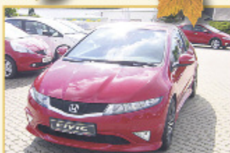
Honda Civic 1.4i-VTEC Type S Roscher Sport Edition. 73 kW (99 PS), rot, Benzin, Schaltgetriebe, Umweltschilde 4 (grün), Klimaanlage, EZ 12/2008, Baujahr 2008 25.200 km 13.200 EUR