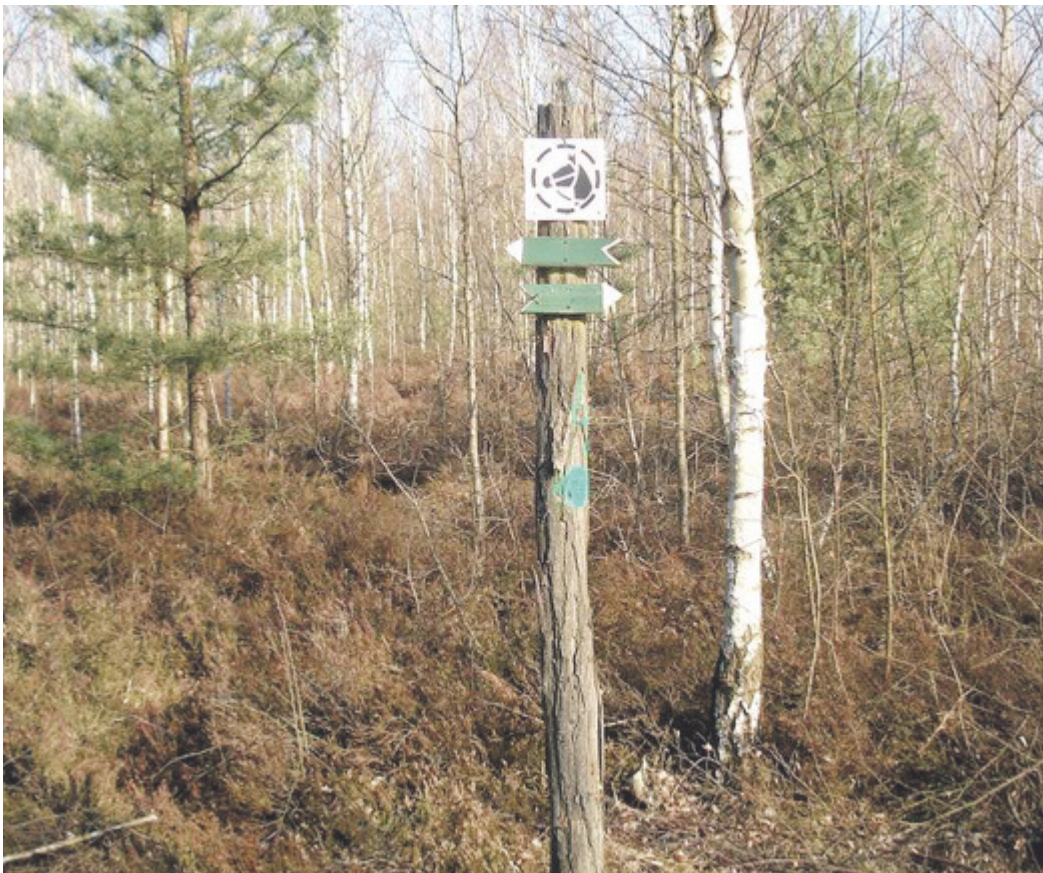
Reitwege sind im Landkreis Bautzen mit diesem Signet ausgeschildert.