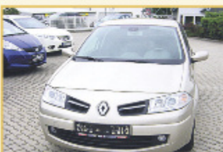
Renault Mégane 1.6 Arantape, 1. Hd., Scheckhelt, 82 kW (111 PS), beige, Benzin, Schaltgetriebe, Umweltschilde 4 (grün), Klimaanlage, EZ 11/2008, Baujahr 2008 20.650 km 9.490 EUR