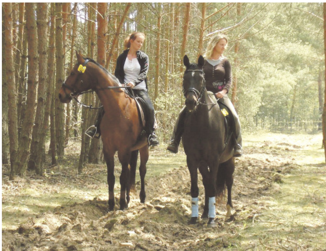
Innerhalb der Wälder Sachsens darf nur auf den dafür ausgewiesenen Wegen geritten werden.

Reiten ohne Grenzen? Nicht ganz! Das Reiten unterliegt wie auch andere Freizeitaktivitäten in der Natur einigen Beschränkungen. Das ist logisch, denn schließlich bewegt man sich auf Flächen an denen Eigentumsrechte bestehen. Darüber hinaus ist Reiten nur eine von vielen Möglichkeiten der Freizeitgestaltung. Einige derselben lassen sich ohne Probleme gut koordinieren, andere benötigen Regeln. Beim Reiten spielt die Eignung der Wege eine wichtige Rolle: Zustand, Breite und