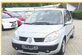
Renault Scénic 1.8 16V, 83 kW (113 PS), blau, Benzin, Schaltgetriebe, Umweltschilde 4 (grün), Klimaanlage, EZ 06/2003, Baujahr 2003 81.500 km 6.290 EUR