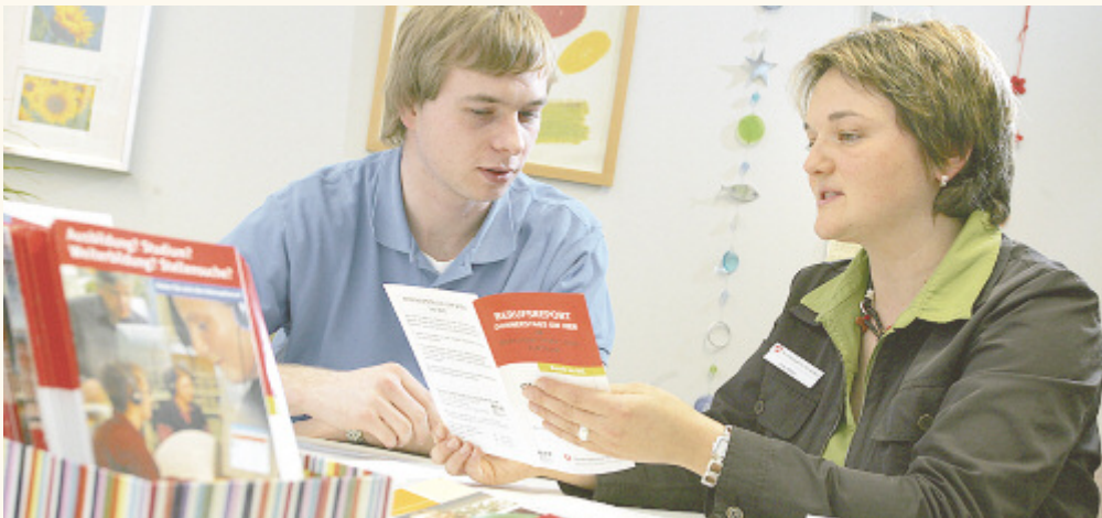
Die Beratung und Unterstützung der Jobcenter-Mitarbeiter half im Zuständigkeitsbereich Bautzen sowie Kamenz/Hoyerswerda 659 jungen Menschen beim Übergang von der Schule in das Berufsleben.

Beim Blick auf die Zahlen der Ausbildungsvermittlung für das Schuljahr 2011/ 12 wird Erfreuliches deutlich: