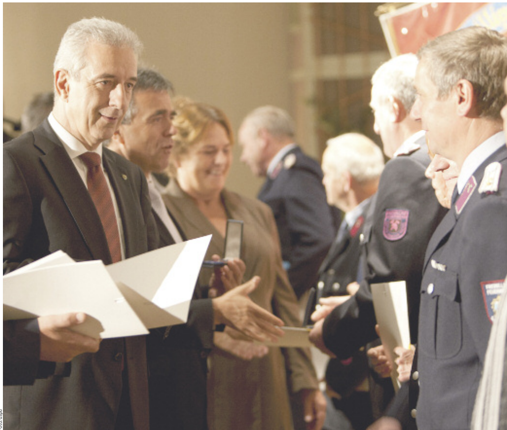
Ministerpräsident Stanislaw Tillich ließ es sich im Kulturhaus Bischofswerda nicht nehmen, selbst einige der außerordentlichen Auszeichnungen an die Kameraden der Freiwilligen Feuerwehren des Landkreises zu übergeben.

Für langjährige aktive Dienste und für besondere Verdienste auf dem Gebiet des Feuerlöschwesens erhielten am 7. und 14. Oktober 2011 insgesamt 360 Kameraden der Freiwilligen Feuerwehren aus dem Landkreis Bautzen eine Auszeichnung.