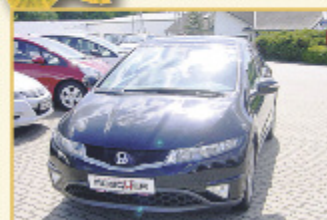
Honda Civic 1.4i-DSI Sport 17 Zoll, 61 kW (83 PS), schwarz, Benzin, Schaltgetriebe, Umweltschilde 4 (grün), Klimaanlage, EZ 05/2007, Baujahr 2007 78.900 km 10.430 EUR