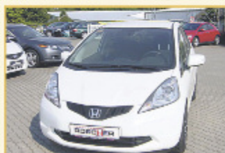
Honda Jazz 1.4i-VTEC Comfort 17 Zoll, 73 kW (99 PS), weiß, Benzin, Schaltgetriebe, Umweltschilde 4 (grün), Klimaanlage, EZ 11/2008, Baujahr 2008 52.400 km 11.490 EUR