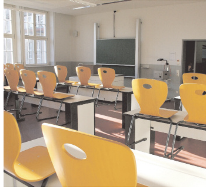
Nach zweijähriger Bauzeit wurde der Nordflügel des Goethe-Gymnasiums in Bischofswerda (Foto oben links) Anfang Oktober seiner Bestimmung übergeben. Neben modernisierten Klassenräumen (Foto oben rechts) und Fachkabinetten, wurde auch der Schulclub auf Vordermann gebracht. Auch die Cafeteria (Foto unten) ist nach der Umgestaltung kaum wiederzuerkennen, zeigt sich offen und in zeitgemäßen Farben.