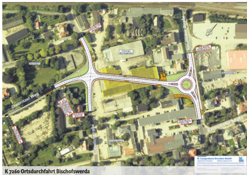
K 7260 Ortsdurchfahrt Bischofswerda

Vierorts herrscht derzeit ein reges Treiben auf den Straßen. Und das ist nicht verwunderlich, denn Schönwetterzeit ist Bauzeit. Damit verbunden sind für viele Verkehrsteilnehmer zumeist unbeliebte Einschränkungen, Umleitungen und Verzögerungen. Diese Zeit kostet zugegebenermaßen Nerven. Sie durchzustehen lohnt aber allemal, denn die stetige Verbesserung des Straßenzustandes im Landkreis nützt am Ende allen.