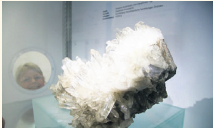
Siliziumdioxid in den verschiedensten Formen ist Teil der neuen Sonderausstellung

Nun sind die Räume im Erdgeschoss des Elementariums auf der Pulsnitzer Str. 16 in Kamenz wieder gefüllt. Einige Wochen lang wurde renoviert, neues Licht installiert, Vitrinen gestellt und ein Sandstrand inklusive Strandkorb aufgebaut. Ein Sandstrand im Elementarium? Ja, doch der wissenschaftliche Blick des Ausstellungsmachers und Geologen vom Museum der Westlausitz, Jens Czoßek, richtet sich nicht auf sonnengebräunte Haut und Sommerspass, sondern auf die unzählbaren Sandkörnerchen, den Grundbaustein jeder Kleckerburg. „Das sind alles kleine Körnerchen aus Siliziumdioxid oder kurz SiO 2 “ beginnt er zu erzählen. Fragende Blicke. „Sili-Was?“ fragt die kleine Paula, welche mit ihren Eltern im Strandkorb sitzt. Jens Czoßek hat mit dieser Frage gerechnet. „Die kleinen Körnerchen sind Minerale und in dieser Form nennen wir sie Quarz“. Aha, und darüber eine ganze Ausstellung machen? „Ja, denn Quarz ist das zweithäufigste Mineral an der