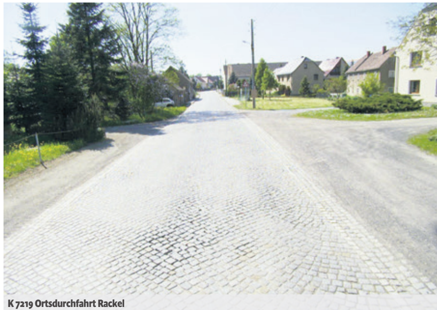
K 7219 Ortsdurchfahrt Rackel