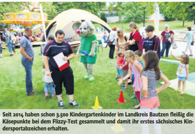
Seit 2014 haben schon 3.500 Kindergartenkinder im Landkreis Bautzen fleißig die Käsepunkte bei dem Flizzy-Test gesammelt und damit ihr erstes sächsisches Kindersportabzeichen erhalten.

„Wer hat die meisten Käsepunkte?“ Unter diesem Motto ist die Sportmaus Flizzy seit 3 Jahren in ganz Sachsen unterwegs. Im Landkreis Bautzen haben schon sehr viele Sportvereine und Kindergärten das Kindersportabzeichen Flizzy an die Kindergartenkinder vergeben