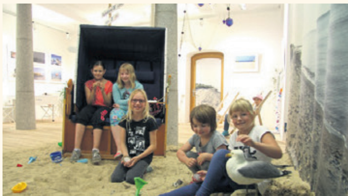
Am eigens für die Ausstellung aufgeschütteten Sandstrand fühlen sich die jungen Ferienbesucher im Museum besonders wohl.