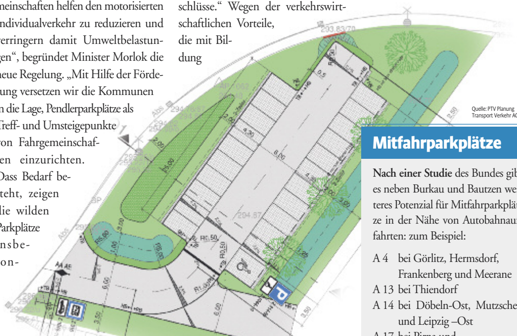
Grafische Darstellung des geplanten Pendlerparkplatzes in Ohorn. Dieser soll gemeinsam mit dem Platz in Burkau als erstes baulich umgesetzt werden.

im Umfeld der Autobahnan-schlüsse.“ Wegen der verkehrswirtschaftlichen Vorteile, die mit Bildung