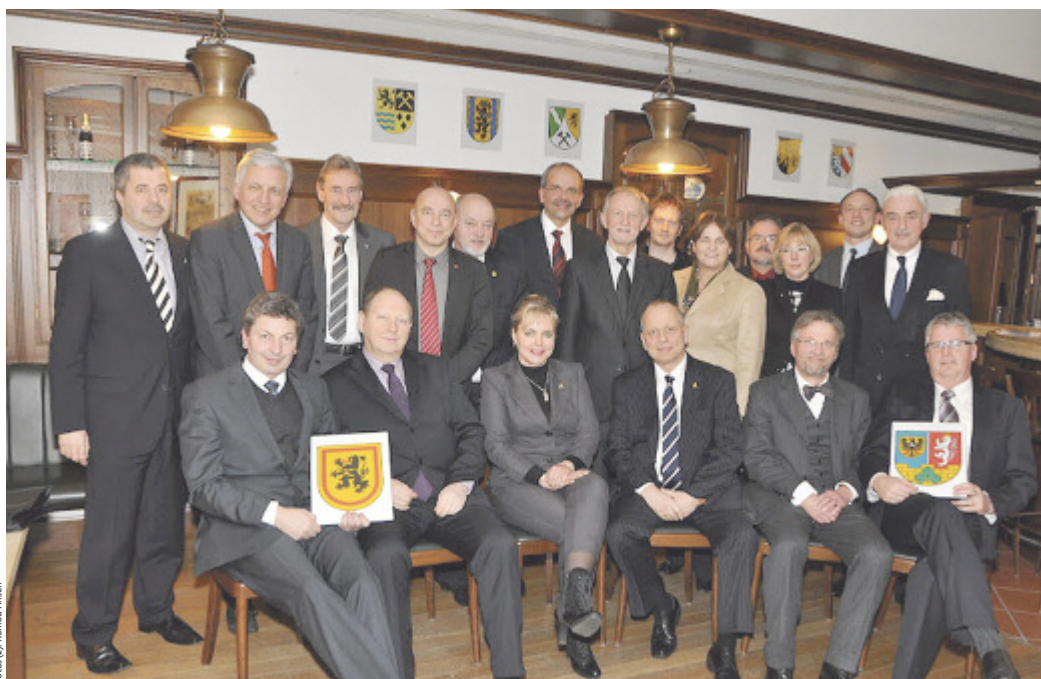
Landräte und Ober-/Bürgermeister der sächsischen Kommunen übergaben am 17. Januar 2012 feierlich ihre Wappen auf Porzellantafeln an Staatssekretär Erhard Weimann, den Bevollmächtigten des Freistaates Sachsen beim Bund.

Bund eingeladen. In seiner Begrüßung betonte der Staatsminister, dass die bisherige gute Entwicklung des Freistaates Sachsen nur gemeinsam, im Zusammenwirken von Kommunen, Land und Bund, möglich war. Dr. Beermann: „Der uns dabei verbindende Leitgedanke wurde mit der Hängung der Wappen der zehn sächsischen Landkreise und drei Kreisfreien Städte in der Landesvertretung bildlich fassbar: Die von Ihnen allen mitgestaltete, geliebte Politik dient und zielt auf das Wohl Sachsens – also dem Wohl der sächsischen Kommunen, des Freistaates und seiner Stellung im föderalen Gefüge der Bundesrepublik gleichermaßen.“ Hauptredner war der Staatsminister bei der Bundeskanzlerin Eckart von Kläden.