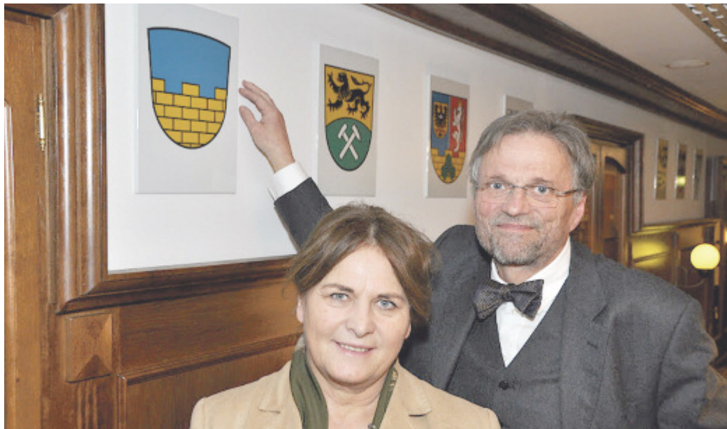
Bundestagsabgeordnete Maria Michalk und 1. Beigeordneter des Landrates, Dr. Wolfram Leunert vor der Tafel mit dem Wappen des Landkreises Bautzen

Die zehn Landkreise und die drei Kreisfreien Städte des Freistaates Sachsen sind nun symbolisch in der Bundeshauptstadt vertreten. Landräte und Ober-/ Bürgermeister der sächsischen Kommunen übergaben am 17. Januar 2012 feierlich ihre Wappen auf Porzellantafeln an Staatssekretär Erhard Weimann, den Bevollmächtigten des Freistaates Sachsen beim Bund.