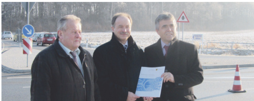
Burkau Bürgermeister Hans-Jürgen Richter, Staatsminister Sven Morlok und Landrat Michael Harig (v.l.n.r.) stehen gemeinsam an der Stelle, an der der Pendlerparkplatz in Burkau gebaut werden soll.

Im Rahmen der kommunalen Straßenbauförderung fördert der Freistaat nun auch den Bau von Mitfahrparkplätzen. Angeregt wurde dies vom Landkreis Bautzen. Dieser wird nun als erster von der Unterstützung des Freistaates profitieren: mit einem Zuschuss von 422.000 Euro können zwei neue Parkplätze an den beiden Anschlussstellen Ohorn und Burkau der A 4 gebaut werden. Dank der erweiterten Förderrichtlinie für Straßen- und Brückenbauvorhaben in kommunaler Bausträtägerschaft (RL-KStB) wird es möglich.