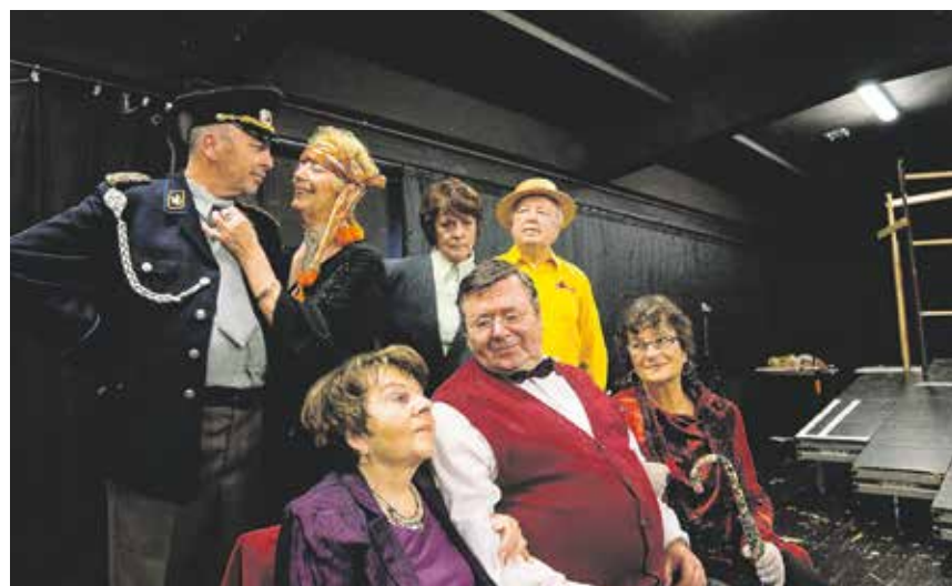
Die Inszenierung ist ein Projekt der Hillerschen Villa in Kooperation mit dem Gerhart-Hauptmann-Theater Zittau.

Gastspiel des Seniorentheaterclubs Zittau