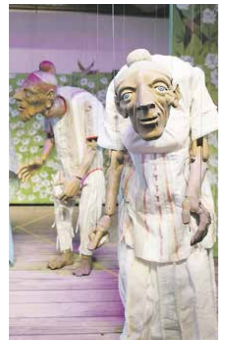
Eine Marionettenoper ist eine seltene, fast exotische und doch vertraute Theaterform – und vor allem: prachtvolle Musik!

Regie: Therese Thomaschke Ausstattung: Eberhard Keienburg a.G. Marionettenspiel und Maskenspiel im Götterrat: das Ensemble des Puppentheaters Musikalische Leitung: Jan Michael Horstmann Chor und Solisten der Landesbühnen Sachsen Orchester: Ensemble Charpentier der Elbland Philharmonie Sachsen