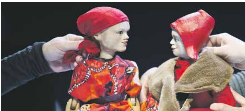
Zum letzten Mal wird im Dezember die Geschichte des einsamen kleinen Mädchens gezeigt.

Die Inszenierung »Wintermärchen« zum letzten Mal