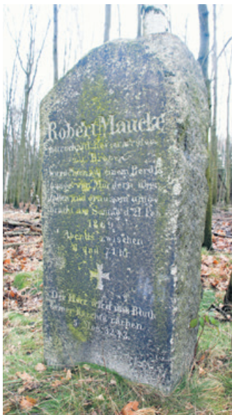
Der Maucke-Stein bei Opitz für einen durch Wilddiebe ermordeten Förster.

Die Oberlausitz ohne Wälder ist undenkbar. Sie prägten und prägen die Landschaft, die Arbeit und das Wohnen der Menschen hier. Darüber hinaus konservieren Wälder Geschichte und Geschichten. Nicht selten finden wir auf unseren Spaziergängen oder Wanderungen im Wald davon steinerne Zeugnisse aus der Vergangenheit. Oft sind es Grenzmarkierungen des Waldbesitzes, die bis heute als sichtbare Zeichen bestehen. Andere Steine markieren Ereignisse, die sich hier abgespielt haben. Nicht wenige künden von der mühevollen und körperlich schweren Arbeit bei der Waldbewirtschaftung, die bis heute alles andere als ungefährlich ist. Andere zeugen von harten Zeiten in Kriegs- und Hungerjahren.