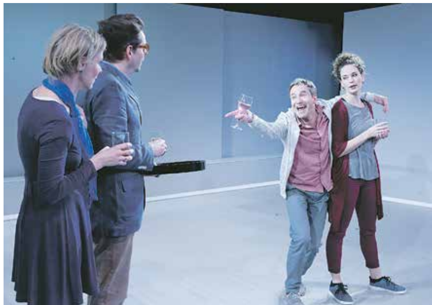
Schön geordnete Mittelstandswelt! Die gleich aus den Fugen gerät, wenn über Wirklichkeit nicht nur geredet wird, sondern sie auch an die Haustür klopft.