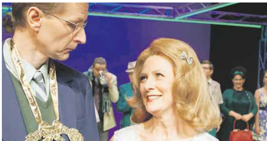
Wunderschöne Melodien (bei weitem nicht nur »O mein Papa«), tolle Ensembles, eine Menge Action und viel fürs Auge!

Am 6. Januar, 19.30 Uhr feiert im großen Haus die musikalische Komödie »Das Feuerwerk« Premiere in einer Inszenierung der Landesbühnen Sachsen, Radebeul. Auf der gutbürgerlichen Feier zum 60. Geburtstag eines Kleinstadt-Fabrikanten erscheint zum Entsetzen der Gäste unerwartet »fahrendes Volk«: Alexander,