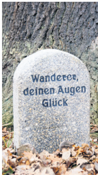
Der Gottfried-Unterdörfer-Stein bei Huhst/Spree.

Der Wert der Grenzsteine und Denkmale im Wald liegt in der Kombination des Objekts mit seiner Umgebung. Das Suchen und Finden der Denkmale ist sicher eine schöne und sinnvolle Freizeitbeschäftigung. Auf kurzen oder längeren Wanderungen können sie als Ziel- oder Wegpunkt einbezogen werden. Neben dem Naturerleben gibt es zusätzlich ein Stück Heimatgeschichte zu er-