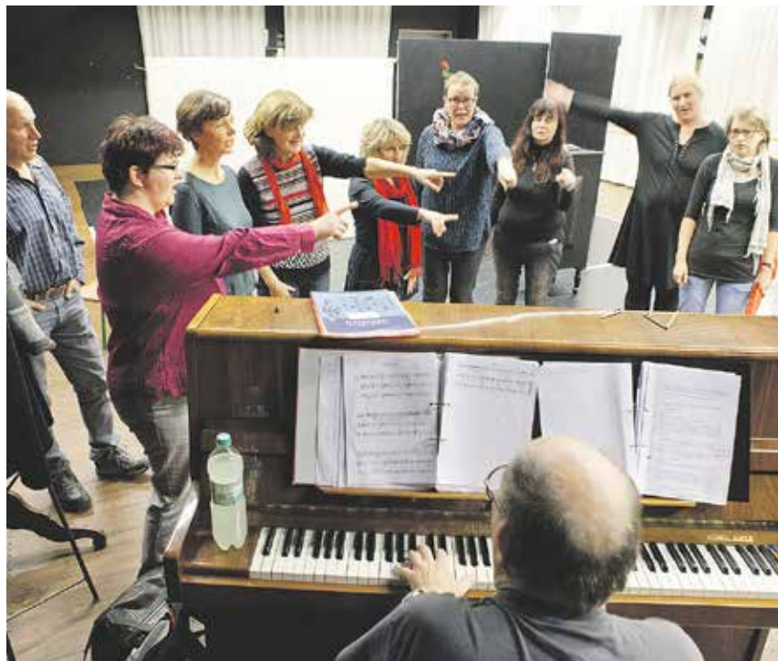
Mit Witz, Humor und bewegender Musik fragt die Komödie nach dem heiklen Verhältnis zwischen individueller Sehnsucht und gesellschaftlicher Verantwortung.

Darstellendes Spiel kann: Schüler in ihrer Kreativität fördern, helfen, ihre gesellschaftlichen, emotionalen und ästhetischen Fähigkeiten auszubilden, die eigene Wahrnehmung einzuschätzen, sprachliche Kompetenz fördern, Hemmungen abbauen, Freude an flexibleren Verhaltensschemata entwickeln, Themen aus den Fächern Deutsch, Musik, Sport, Ethik, Sozialkunde, Musik vertiefen. An unzähligen sächsischen Schulen und Kindereinrichtungen wird Theater gespielt, theaterbegeisterte Lehrer, die den Vorteil für ihre Schützlinge längst erkannt haben, zaubern in ihrer Freizeit die schönsten Aufführungen. Und sie sind immer wieder auf der Suche nach