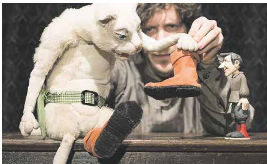
Das Theater auf der Zitadelle hat »Die gestiefelte Katze« und »Rumpelstilzchen« im Gepäck.

Eine Katze, die nie ein Kater war, und ein namenloser Kindsräuber