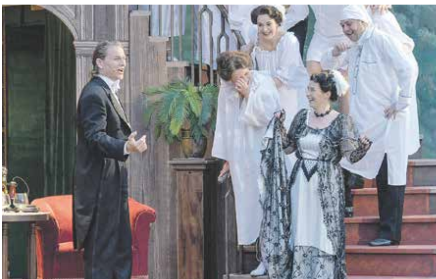
Elisas fürchterliches Kauderwelsch reizt den verschrobene Sprachprofessor Higgins zu der bekanntesten Wette der Theatergeschichte.

Am 23. Dezember, 19.30 Uhr und am 29. Januar, 18 Uhr wird »My Fair Lady« im großen Haus zu erleben sein. Denn wenn der Sprachforscher Professor Higgins mit seinem Fachkollegen Pickering wettet, dass er die »Rinnsteinpflanze« Elisa Dulitsch innerhalb von sechs Monaten zu einer Dame mit gepflegter Ausdrucksweise erziehen kann, wird es nicht nur beschwingt und musikalisch auf der Bautzener Bühne, sondern die hinreißenden Dialoge und Evergreens wie »Es grünt so grün, wenn Spaniens Blüten blühen« und »Mit 'nem kleenem Stückchen Glück«