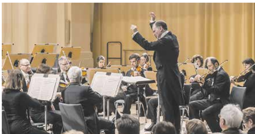
Starten Sie ins neue Jahr mit spanischem Temperament und südlichen Rhythmen.

Am 17. Januar, 19.30 Uhr erklingt im großen Haus Bautzen das Neujahrskon-zert der Mittelsächsischen Philharmonie »Eviva Espana«, unterstützt vom Lions Club Bautzen. »Eviva Espana!« heißt es beim Neujahrskonzert, mit dem die Mittel-sächsische Philharmonie das Jahr 2017 willkommen heißt. Bekannte spanische und spanisch klingende Melodien und Rhythmen entführen das Publikum ins