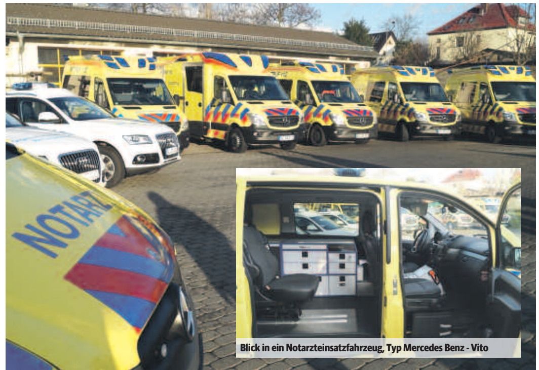
Blick in ein Notarzteinsetzfahrzeug, Typ Mercedes Benz - Vito