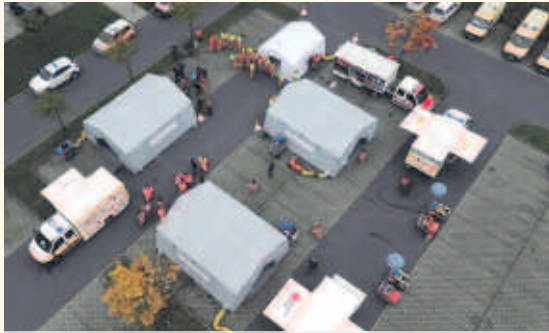
Dank der Freiwilligen Feuerwehr Kamenz und deren Drehleiter konnte das Übungsgeschehen aus der Vogelperspektive fotografisch festgehalten werden.

Mithilfe dieser aus Zelten bestehenden Behandlungsstätte sind die Einsatzkräfte im Ernstfall in der Lage, mindestens 50 Verletzte pro Stunde aufzunehmen, medizinisch zu behandeln und zu betreuen bis deren Transport in die Kliniken erfolgen kann.