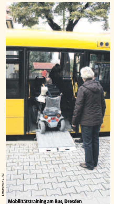
Mobilitätstraining am Bus, Dresden

Kontakt: Franziska Pohling Beauftragte für Belange von Menschen mit Behinderungen Landratsamt Bautzen E-Mail: behindertenbeauftragte@lra-bautzen.de