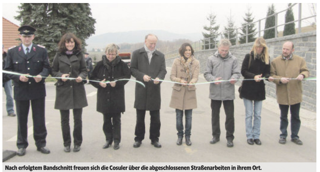
Nach erfolgreichem Bandschnitt freuen sich die Cosuler über die abgeschlossenen Straßenarbeiten in ihrem Ort.

Besonderes Augenmerk legten Planer und Ausführende dabei auf den Erhalt des Charakters der Ortslage. Um den denkmalpflegerischen Gedanken zu bewahren, wurde Naturstein verarbeitet.