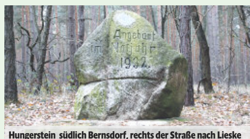
Hungerstein südlich Bernsdorf, rechts der Straße nach Lieske

Kreisforstamtes (siehe Kasten) übermittelt werden. Der Stein trägt die Aufschrift «Angebaut im Notjahr 1932». Er erinnert an die Tätigkeit des freiwilligen Arbeitsdienst FAD. Heute befindet sich hinter dem Stein ein stattlicher Kiefernwald von 80 Jahren. Ein angrenzender, ebenfalls zu diesem Zeitpunkt angebaute Bestand fiel einem Waldbrand zum Opfer. Auch diese Fläche wurde wieder aufgeforstet.