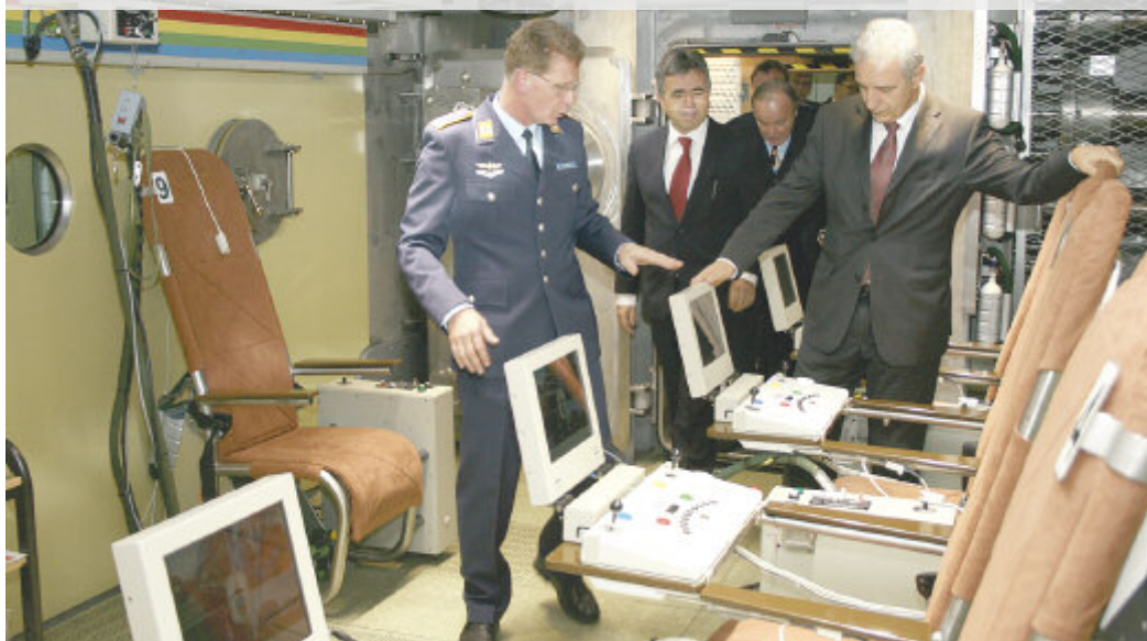
Ministerpräsident Stanislaw Tillich (rechts) und Michael Harig in der generalüberholten Höhenklimasimulationskammer des flugmedizinischen Institutes der Luftwaffe in Königsbrück. Die Auszubildenden der Luftwaffe werden in dem hermetisch abriegelbaren Raum einem höhenähnlichen Klima ausgesetzt und dabei medizinisch überwacht.

Nach Einschätzung des Ministerpräsidenten ist die Einrichtung am Standort Königsbrück zu einem «Center of Excellence» geworden und gehört somit zu den weltweit modernsten Ausbildungsstätten für angehende Jetpiloten. Tillich reihte die Königsbrücker Institution in die umfangreiche sächsische Forschungslandschaft ein und lobte den überaus hohen regionalen Stellenwert für die Wissenschaft.