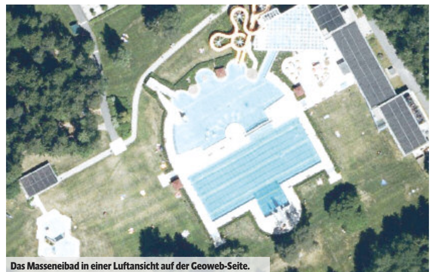
Das Masseneibad in einer Luftansicht auf der Geoweb-Seite.