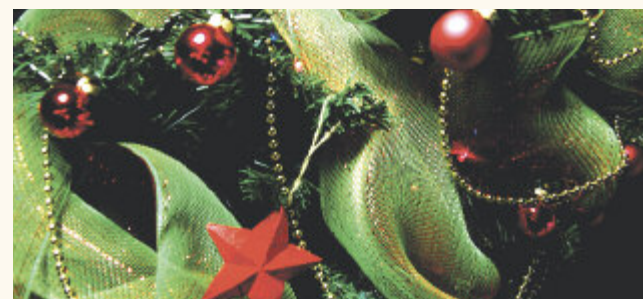
Die Dekoration wandert in die Kiste, aber wohin mit dem Weihnachtsbaum?

Die Mitnahme erfolgt ausschließlich in der Zeit vom 02.01.2013 bis 31.01.2013. Für später zur Entsorgung anfallende Bäume muss eine der Varianten 1 oder 2 gewählt werden. Eventuell in den Gemeinden zusätzlich getroffene Regelungen bleiben hiervon unberührt.