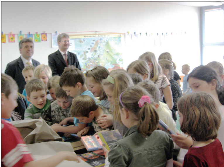
Die Kinder der Grundschule Medingen beim Auspacken der Bücher. Im Hintergrund Landrat Michael Harig und Präsident des Rotary Clubs Radeberg, Jens Beyer

Wachau. Die Gemeinschaftsaktion von Rotary und dem Sächsischen Staatsministerium für Kultus will damit das Lesen bei Kindern fördern, um ihnen den Sprung in die Zukunft zu erleichtern.