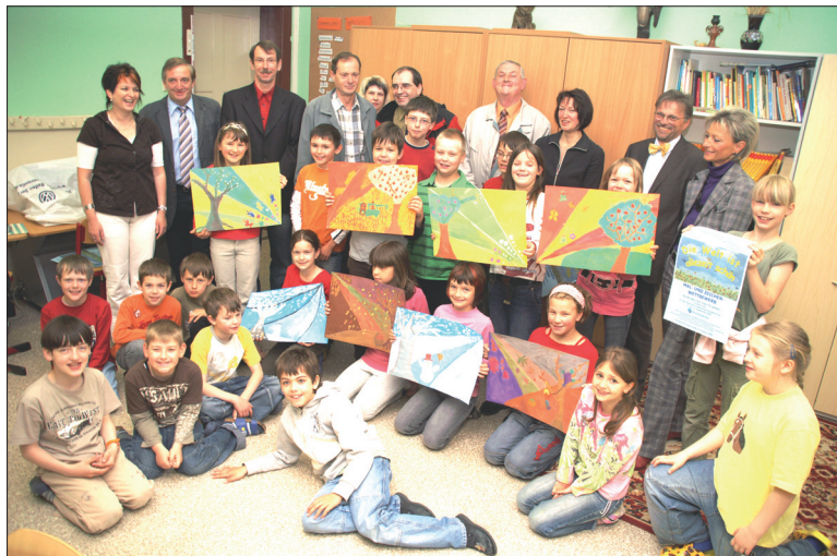
Mädchen und Jungen der Klasse 3 der Grundschule Goldbach waren die Ersten, die Bilder zum Mal- und Zeichenwettbewerb anlässlich des Landeserntedankfestes in Bischofswerda einreichten. Darüber freuten sie sich genau so wie die Gäste, die zur Eröffnung des Wettbewerbes gekommen waren.

Zur weiteren Information: Vom 11. bis 13. September 2009 ist die Stadt Bischofswerda Gastgeber des 12. Sächsischen Landeserntedankfestes. Gemeinsam mit dem Landkreis Bautzen und dem Sächsischen Landeskuratorium Ländlicher Raum e.V. (SLK) organisiert sie die Veranstaltung, wobei sie von Bürgern, Vereinen, Verbänden, Kirchen, Schulen, Institutionen und Behörden der Stadt, der Region und aus dem ländlichen Raum tatkräftig unterstützt werden. Sachsens größtes Erntedankfest hat sich, auch dank der Unterstützung durch das Sächsische Staatsministerium für Umwelt und Landwirtschaft, zu einer traditionsreichen Veranstaltung entwickelt und ist Spiegelbild der Leistungen der Menschen aus dem ländlichen Raum.