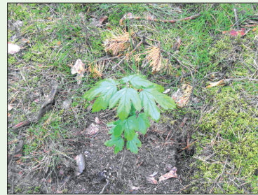
Abb. 4: Blattaustrieb