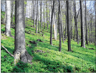
Abb. 1 Ahorn-Linden Blockhalden-Wald in der Oberlausitz bei Hainewalde

Weltweit sind 120-150 Arten der Gattung Acer bekannt, von der in Deutschland drei Arten heimisch sind: der Spitz-Ahorn Acer platanoides L., der Feldahorn, Acer campestre L. und der Berg-Ahorn, Acer pseudoplatanus L.. Dem Berg-Ahorn kommt von diesen drei Baumarten in vielerlei Hinsicht die größte Bedeutung zu.