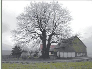
Abb. 2 Der Berg-Ahorn von Wohla

wälder (Abb.1). Sie gehören zu den arten- und facettenreichsten Waldbiotopen in Sachsen. Der Berg-Ahorn ist weit verbreitet als Parkbaum und als Straßen- bzw. Alleebaum, im Hügels- und Bergland, auch in der Lausitz, häufig als „Hausbaum“ in Grundstücken (Abb.2)