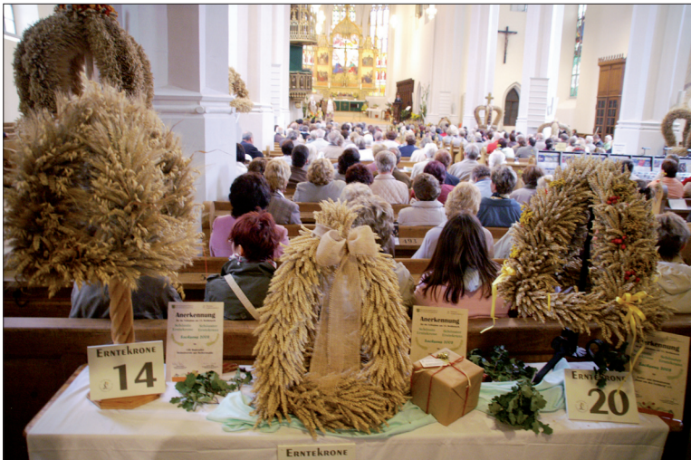
Im Rahmen des 11. Sächsischen Landeserntedankfestes im letzten Jahr in Oschatz fand der 15. Wettbewerb des Sächsischen Landfrauenverbandes e.V. um die „Schönste Erntekrone“ und den „Schönsten Erntekranz“ Sachsens statt. Die Ausstellung zum Wettbewerb in der St. Aegidienkirche Oschatz war gut besucht. Zu sehen gab es große wie kleine Erntekronen und Erntekränze.