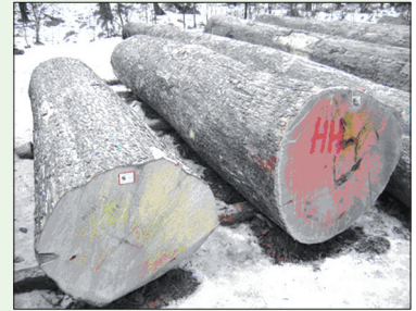
Abb. 5: Verkaufssieger: Berg-Ahorn Stämme auf der Wertholzsubmission 2009

Der Berg-Ahorn gehört zu den wertvollsten heimischen Edellaubhölzern. Auf der jährlich stattfindenden Wertholzsubmission erzielen Bergahornstämme seit Jahren die besten Verkaufsergebnisse (Abb. 5). Sein Holz ist hart, feinporig, gelblich-weiß bis fast rein weiß mit feiner gleichmäßiger Textur. Splint- und Kernholz sind fast farbgleich. Die seltene Riegelung (Riegelahorn), eine spezielle Form des Faserverlaufes, erhöht den Wert entscheidend und ist im Holzhandel sehr begehrt. Ebenso der so genannte „Vogelaugen-Ahorn“, hervorgerufen durch eine mit Astknötchen durchsetzte Maserbildung.