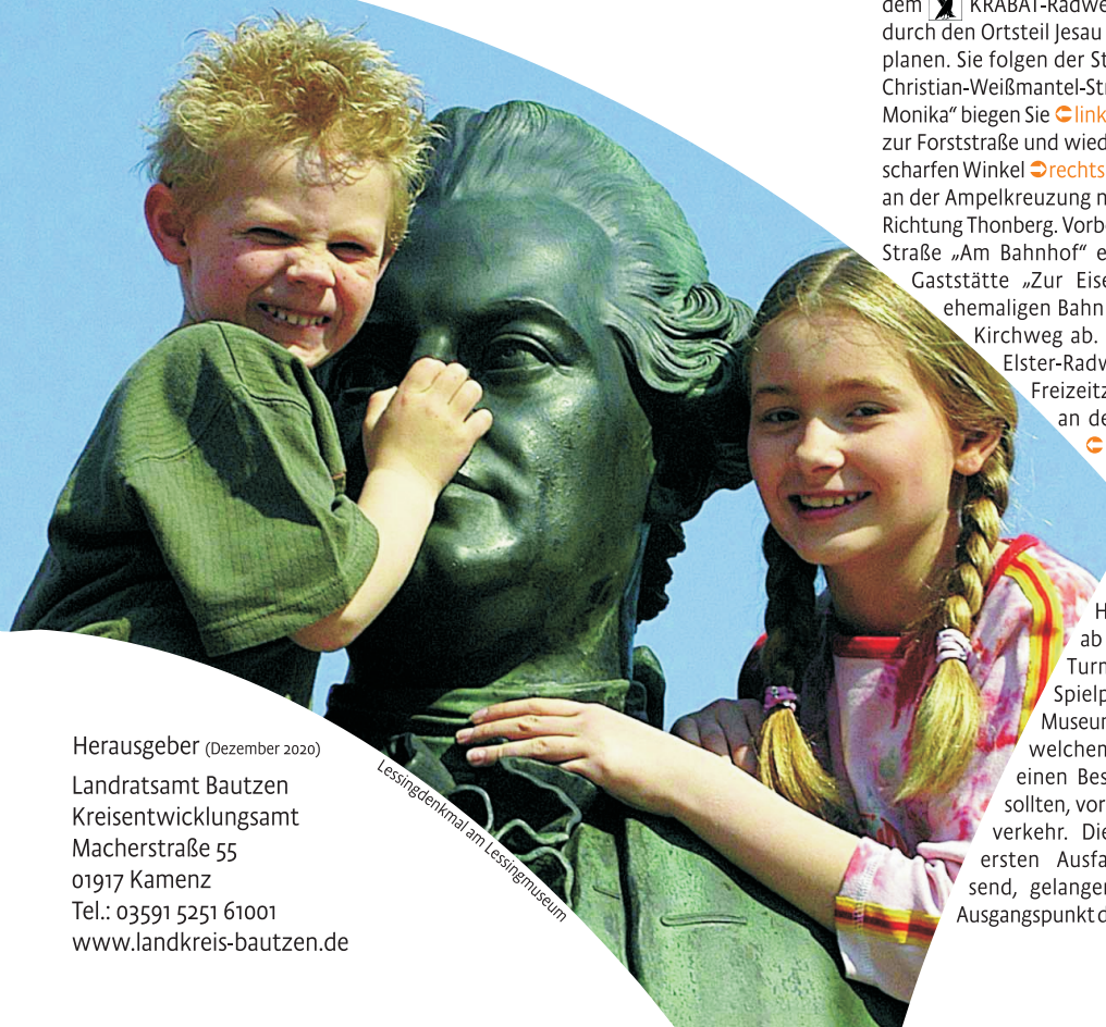
Lessingdenkmal am Lessingmuseum