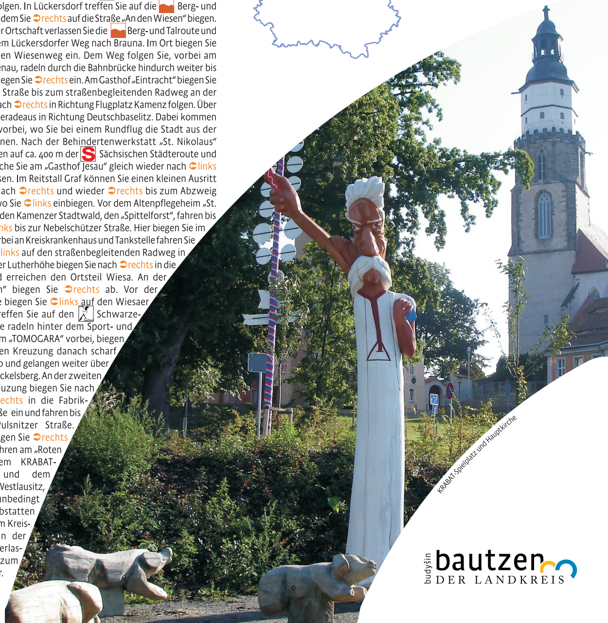
KRABAT-Spielplatz und Hauptkirche

Herausgeber (Dezember 2020) Landratsamt Bautzen Kreisentwicklungsamt Macherstraße 55 01917 Kamenz Tel.: 03591 5251 61001 www.landkreis-bautzen.de